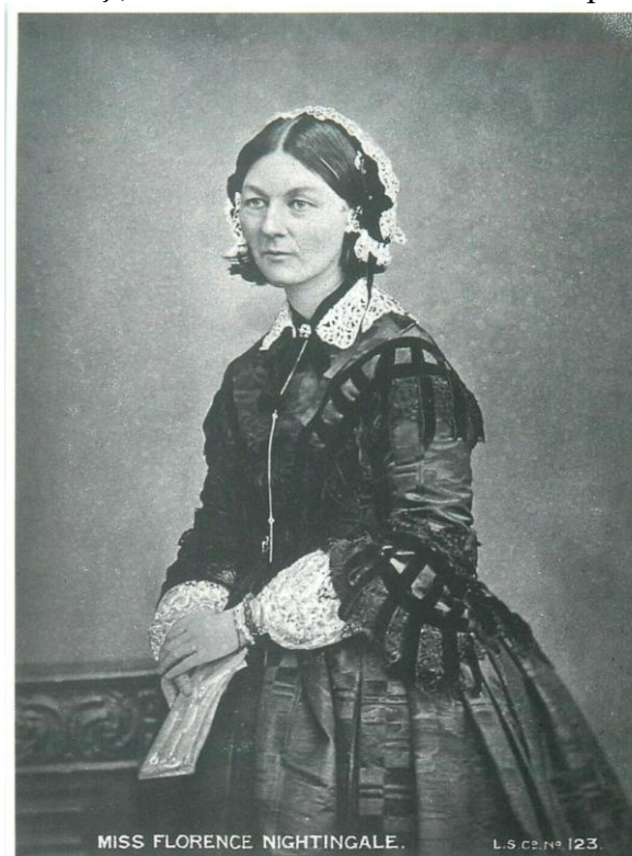
Fig. 1. Carte poștală cu portretul lui Florence Nightingale.

Portretul lui Florence Nightingale este redat între altele pe cartea poștală din Fig. 1.