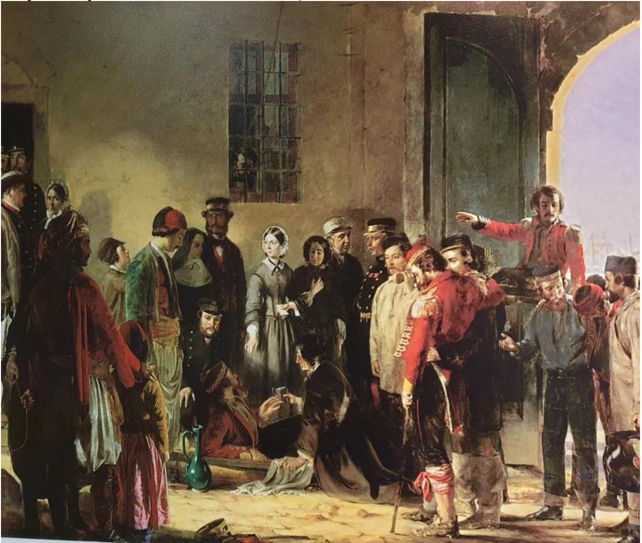
Fig. 2. Activitatea de îngrijire a lui Florence Nightingale (Muzeul Florence Nightingale, fotografie 2019; realizată cu ocazia vizitării muzeului și reprodusă cu acordul Muzeului).

sub intemperii. Să nu uităm că ideea de a înființa Crucea Roșie i-a venit lui Henri Dunant după ce a văzut descumpănit urmările luptei de la Solferino din 1859, deci se poate spune că Dunant și Nightingale au fost nu doar contemporani ci au intuit aproape simultan nevoia de a acționa în favoarea victimelor războiului și a prizonierilor de război (Nightingale F., 2010).