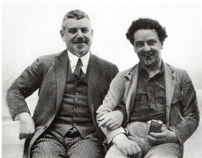
Fig. 3. René Morax et Arthur Honegger

Pour la composition de la partition musicale, Morax s'est tourné au début vers Gustave Doret (1866-1943) qui décline l'offre et refuse et puis vers le compositeur Igor Stravinsky (1882-1971), qui à l'époque habitait Vevey sur les rives du lac Léman. A son tour il décline l'offre mais il confirme l'opinion d'Ernest Ansermet (1883-1969), chef d'orchestre et directeur musical de l'Orchestre symphonique Suisse-Romande de Lausanne, et recommande Arthur Honegger (1892-1953), compositeur français d'origine suisse, pour cette mission.