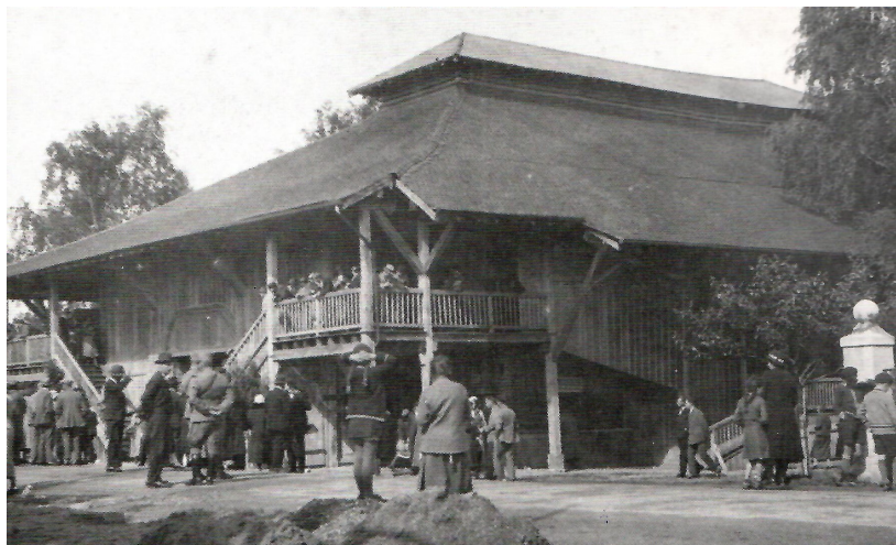
Fig. 1. Théâtre Jorat à Mézières

L'existence d'événements théâtraux dans le patrimoine de la culture populaire suisse est un phénomène courant, mais l'objectif de Morax était de créer un théâtre qui offrait à tous une éducation et un accès à la culture et à l'histoire, au niveau des institutions professionnelles et non par des productions faciles de divertissement bon marché.