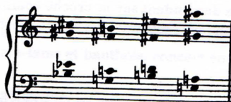
Ex. 6. Thème d'accords