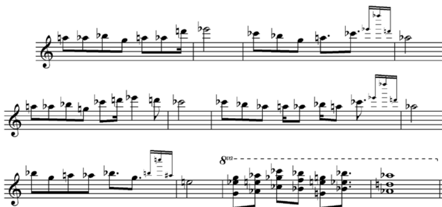
Ex. 4. Vêpres de l'Épiphanie

Musicalement, le thème de l'Étoile et de la Croix s'inspire de la première antienne du deuxième Vêpres de l'Épiphanie. Le thème complet utilise le Mode 7, dans la troisième transposition. ( D Eb E F G Ab A Bb B D ).