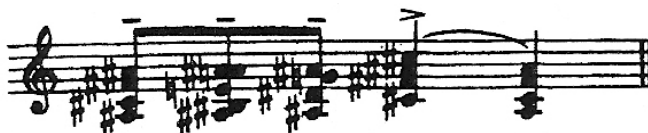
Ex. 2. Messe de la Pentecôte

Le thème peut être entendu dans les mouvements un, cinq, six, dix, onze, quinze et vingt, parce que chacun de ces mouvements s'adresse à la Divinité.