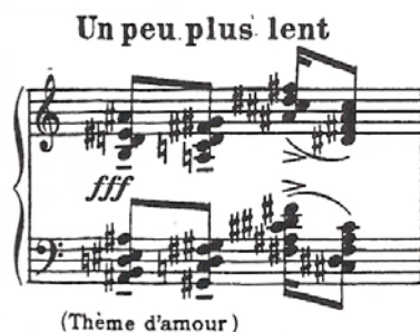
Ex. 5. Motif BACH

Le troisième thème cyclique est le thème de l'amour mystique - dans les mouvements six, dix-neuf et vingt.